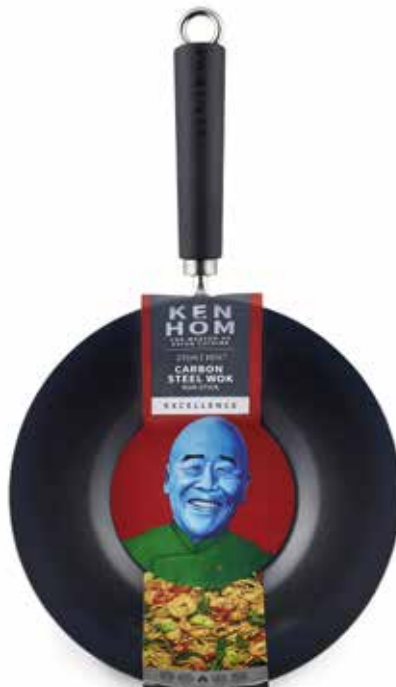
W KH427001 STOCK: ● 27cm Non Stick Carbon Steel Wok