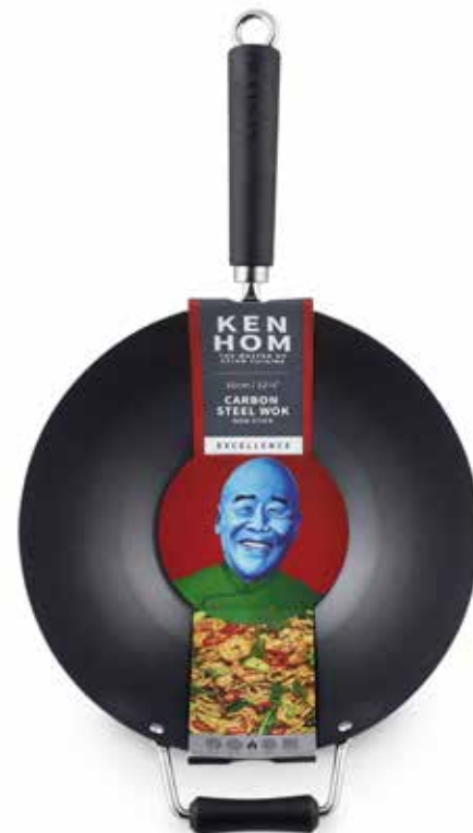
W KH431001 STOCK: ● 31cm Non Stick Carbon Steel Wok