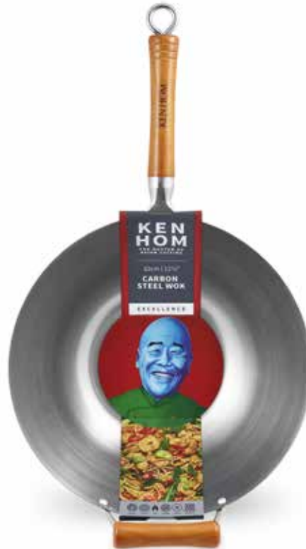
W KH432003 STOCK: ● 32cm Carbon Steel Wok PVP/PL: A € 52,30/€ 42,87 5011268 846205 MIM: 1/6-6