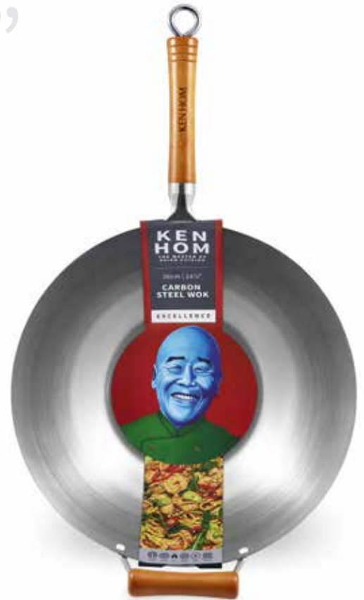
W KH436003 STOCK: ● 36cm Carbon Steel Wok PVP/PL: A € 67,30/€ 55,16 5011268 846236 MIM: 1/6-6