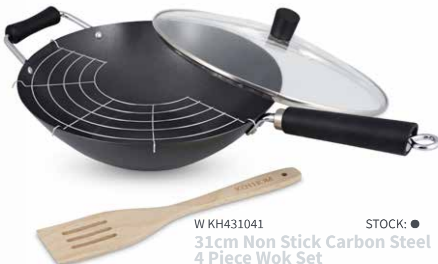
W KH431041 STOCK: ● 31cm Non Stick Carbon Steel 4 Piece Wok Set