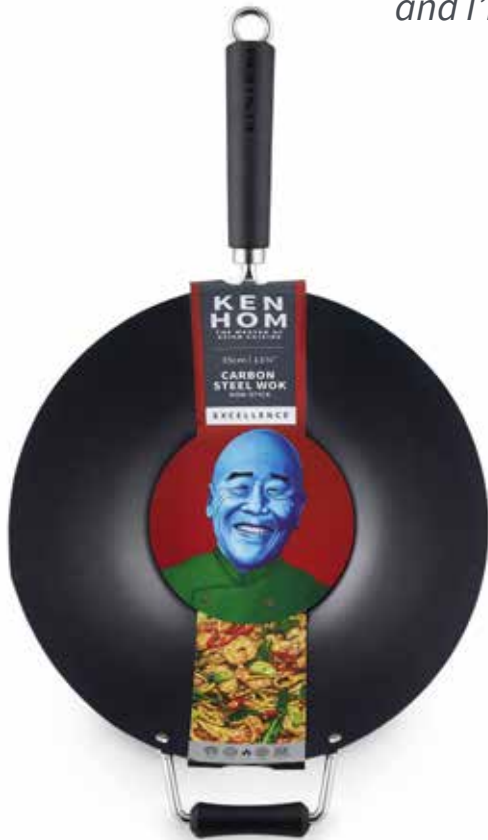
W KH435001 STOCK: ● 35cm Non Stick Carbon Steel Wok PVP/PL: A € 67,30/€ 55,16 5011268 846175 MIM: 1/6-6

“ These woks represent the very best-in-class within my cookware range. The non-stick coating is superb, it heats up faster and needs less oil. Stir-fry cooking has never been easier! I love them and I’m sure you will too. KEN HOM ”