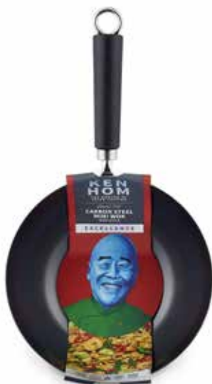
W KH420001 STOCK: ● 20cm Non Stick Carbon Steel Mini Wok