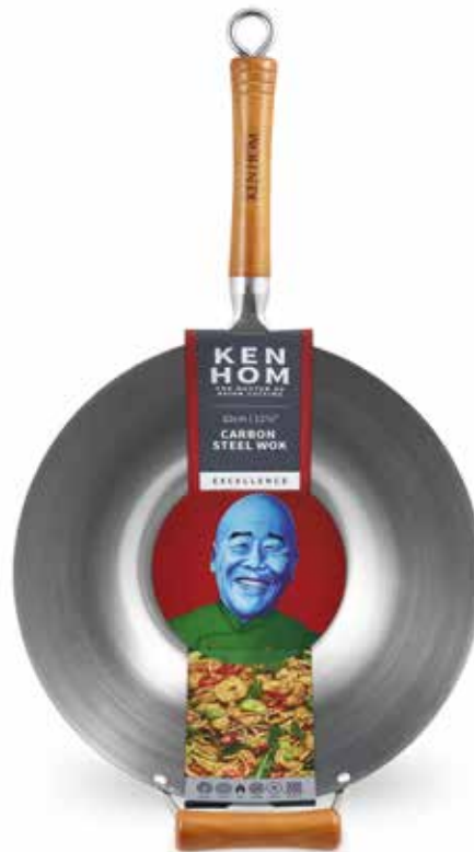
W KH432003 STOCK: ● 32cm Carbon Steel Wok PVP/PL: A € 38,10/€ 31,23 5011268 846205 MIM: 1/6-6