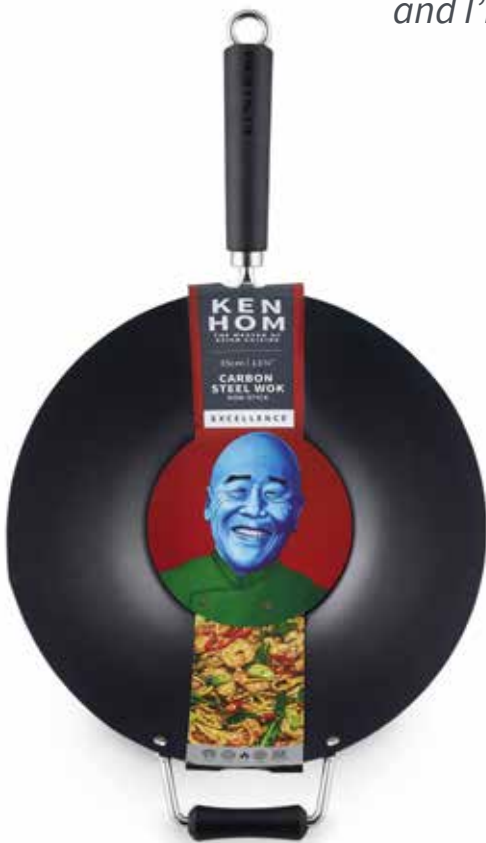
W KH435001 STOCK: ● 35cm Non Stick Carbon Steel Wok PVP/PL: A € 56,40/€ 46,23 5011268 846175 MIM: 1/6-6

“ These woks represent the very best-in-class within my cookware range. The non-stick coating is superb, it heats up faster and needs less oil. Stir-fry cooking has never been easier! I love them and I’m sure you will too. KEN HOM ”