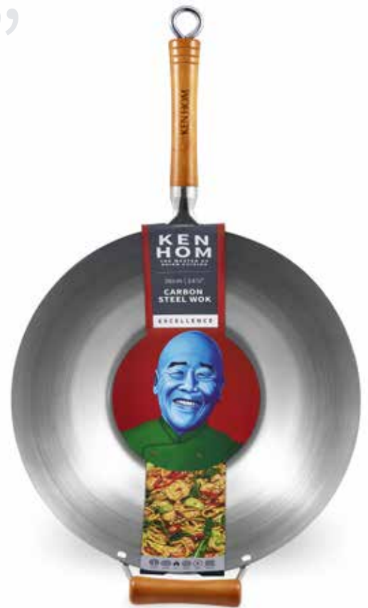
W KH436003 STOCK: ● 36cm Carbon Steel Wok PVP/PL: A € 44,80/€ 36,72 5011268 846236 MIM: 1/6-6