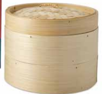
W KH506 STOCK: ● Bamboo Steamer PVP/PL: A € 34,50/€ 28,28 5011268 845611 MIM: 1/4-16