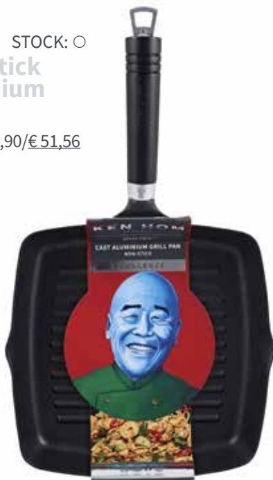
W KH425004 STOCK: ○ 25cm Non Stick Cast Aluminium Grill Pan PVP/PL: A € 62,90/€ 51,56 5011268 846328 MIM: 6/12-12